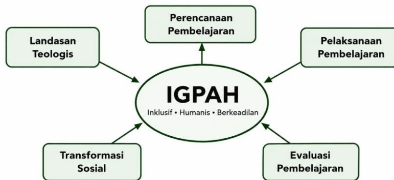
Gambar 1. Model IGPAH sebagai kerangka integrasi gender dalam pembelajaran Al-Qur'an Hadis

Gambar tersebut memperlihatkan bahwa Model IGPAH menempatkan integrasi gender dalam pembelajaran Al-Qur'an Hadis sebagai proses yang bersifat sistemik, bukan sekadar tambahan materi dalam kegiatan pembelajaran. Landasan teologis menjadi dasar utama agar nilai kesetaraan dipahami sebagai bagian dari ajaran Islam, bukan konsep eksternal yang terpisah dari pendidikan agama. Nilai tersebut kemudian diterjemahkan ke dalam perencanaan pembelajaran, pelaksanaan pembelajaran, evaluasi pembelajaran, dan diarahkan pada transformasi sosial. Dengan demikian, Model IGPAH menegaskan bahwa pembelajaran Al-Qur'an Hadis yang responsif gender harus dimulai dari pemahaman normatif yang adil, diwujudkan dalam praktik pedagogis yang inklusif, dinilai melalui evaluasi yang komprehensif, serta menghasilkan kesadaran sosial peserta didik untuk menghargai martabat laki-laki dan perempuan secara setara.