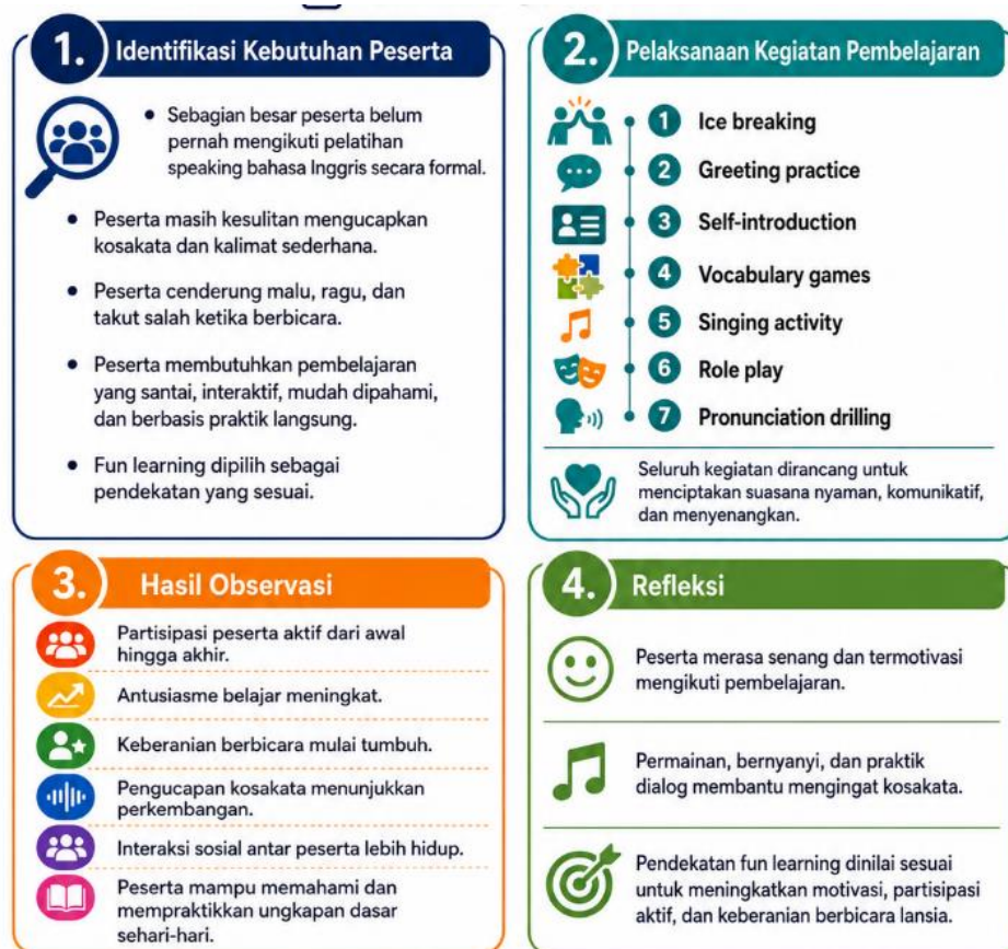
Gambar 2. Hasil Pelaksanaan Kegiatan Fun Learning “Penguatan Kemampuan Speaking Bahasa Inggris pada Lansia di Sekolah Lansia Cahaya Kartini”

Kegiatan pengabdian kepada masyarakat dengan judul “Penguatan Kemampuan Speaking Bahasa Inggris pada Lansia melalui Pendekatan Fun learning di Sekolah Lansia Cahaya Kartini” dilaksanakan pada tanggal 19 Februari 2026 di Sekolah Lansia Cahaya Kartini. Kegiatan ini bertujuan untuk meningkatkan kemampuan speaking bahasa Inggris peserta lansia melalui pendekatan pembelajaran yang menyenangkan, interaktif, dan sesuai dengan karakteristik peserta lanjut usia.