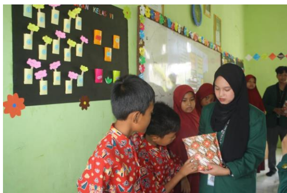
Gambar 4. Pembagian Hadiah Bagi Siswa Paling Aktif