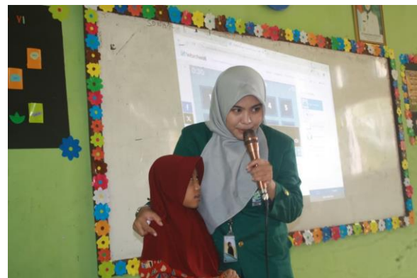
Gambar 3. Siswa Menjawab Pertanyaan Yang Diberikan