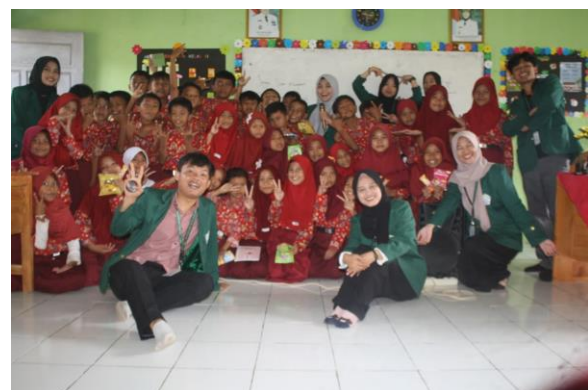
Gambar 5. Foto Bersama Siswa SD Negeri 19 Padang Cermin

Pada tahap pelaksanaan sosialisasi pemateri menyampaikan beberapa point penting yang harus dipahami terkait bullying . Pertama jenis-jenis bullying , menurut Lina Muntasiroh, (2019), perilaku bullying dibagi menjadi dua, yaitu bullying fisik dan verbal. Bullying fisik adalah bentuk kekerasan yang melibatkan kontak fisik langsung antara pelaku dan korban. Tindakan ini dapat berupa mencubit, memukul, mendorong, menarik jilbab, menarik kursi saat korban hendak duduk, menjegal, menjambak rambut, hingga melempar bola kertas. Tindakan semacam ini sering kali dilakukan untuk menunjukkan kekuasaan atau membuat korban