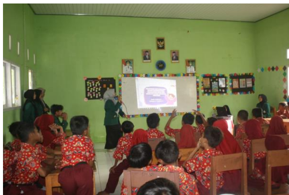
Gambar 2. Pelaksanaan Sosialisasi

Kegiatan diawali dengan pengenalan konsep bullying , jenis-jenis tindakan bullying yang sering muncul di lingkungan sekolah dasar, serta dampak negatifnya terhadap psikologis dan sosial siswa. Materi disampaikan secara interaktif melalui media presentasi, studi kasus sederhana, dan permainan edukatif. Hal ini tergambar jelas dalam dokumentasi kegiatan pada (Gambar 2), di mana siswa tampak aktif merespons penjelasan pemateri dengan mengangkat tangan, memperhatikan tayangan materi, serta terlibat dalam interaksi kelas. Antusiasme tersebut menunjukkan bahwa meskipun sebagian besar siswa sebelumnya belum memahami secara utuh makna bullying , sosialisasi ini berhasil mendorong peningkatan kesadaran mereka. Setelah kegiatan, siswa mulai menunjukkan perubahan sikap, seperti meningkatnya empati terhadap teman sebaya, keberanian menolak tindakan perundungan, serta pemahaman lebih baik tentang pentingnya saling menghargai dalam kehidupan sekolah.