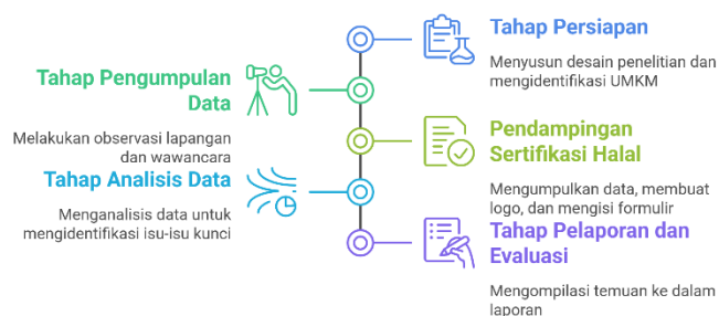
Gambar 1. Timeline Proses Penelitian Sertifikasi Halal UMKM