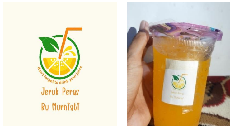
Gambar 3. Pembuatan Logo dan Pemotretan Produk

langkah-langkah yang perlu diambil dalam pengajuan sertifikasi halal. Pada tahap kedua, peneliti membantu Ibu Murniati dalam pembuatan logo produk dan pemotretan produk untuk memenuhi persyaratan sertifikasi halal, termasuk untuk dokumentasi produk yang akan diajukan.