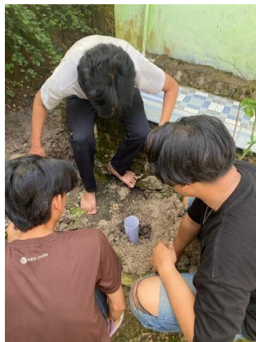
Gambar 2. Sosialisasi Pembuatan Lubang Biopori

Kegiatan sosialisasi mengenai Lubang Resapan Biopori (LRB) diadakan dengan tujuan untuk meningkatkan pemahaman masyarakat Desa Lebung Nala mengenai manfaat ekologis dan ekonomis dari teknologi ini. Sosialisasi disampaikan oleh tim KKN UIN Raden Intan Lampung melalui sesi pemaparan materi dan dilanjutkan dengan diskusi interaktif. Dalam kegiatan ini, masyarakat diberikan pengetahuan tentang berbagai manfaat LRB yang meliputi pencegahan banjir, sebagai tempat pembuangan sampah organik, menyuburkan tanaman, dan meningkatkan kualitas air tanah. Selain itu, manfaat ekonomi dari LRB adalah meningkatkan efektivitas penggunaan lahan untuk menanam sampah organik yang kemudian bisa dijadikan pupuk kompos untuk lahan pertanian, sehingga mengurangi biaya produksi bagi petani. Respon masyarakat terhadap sosialisasi sangat positif, terlihat dari antusiasme mereka dalam mengikuti sesi diskusi. Sebanyak 25 orang warga desa hadir, sebagian besar adalah petani yang langsung tertarik dengan aplikasi LRB untuk pertanian mereka. Diskusi ini tidak hanya memberi pemahaman tetapi juga memperdalam wawasan masyarakat tentang pentingnya mengelola LRB dengan baik.