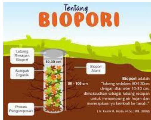
Gambar 3. Ilustrasi Lubang Biopori

Proses pembuatan LRB dilaksanakan dengan menggunakan pipa paralon berdiameter 30 cm dan kedalaman 100 cm, serta mengisi pipa dengan sampah organik seperti daun dan sisa makanan. Keberadaan biopori ini akan memperbesar bidang resapan air dan meningkatkan kemampuan tanah untuk menyerap air hujan (Suleman et al., 2018). Hasil dari penerapan teknologi ini akan langsung terlihat dari berkurangnya genangan air di sekitar mushola.